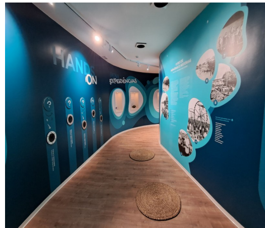
Figura 2 e 3: Sala Expositiva do C-Rio