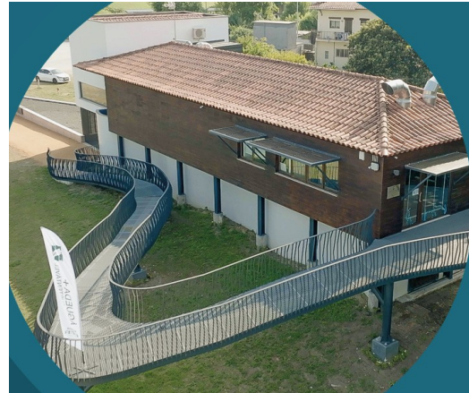
Figura 1: Edifício do C-Rio

O Centro de Interpretação do Rio encontra-se localizado na baixa da cidade de Águeda na margem (sul) confluente ao Rio Águeda, sendo todo o espaço valorizado pelas suas características envolventes que potenciam o desenvolvimento de diversas atividades ambientais, culturais, desportivas, entre outras.