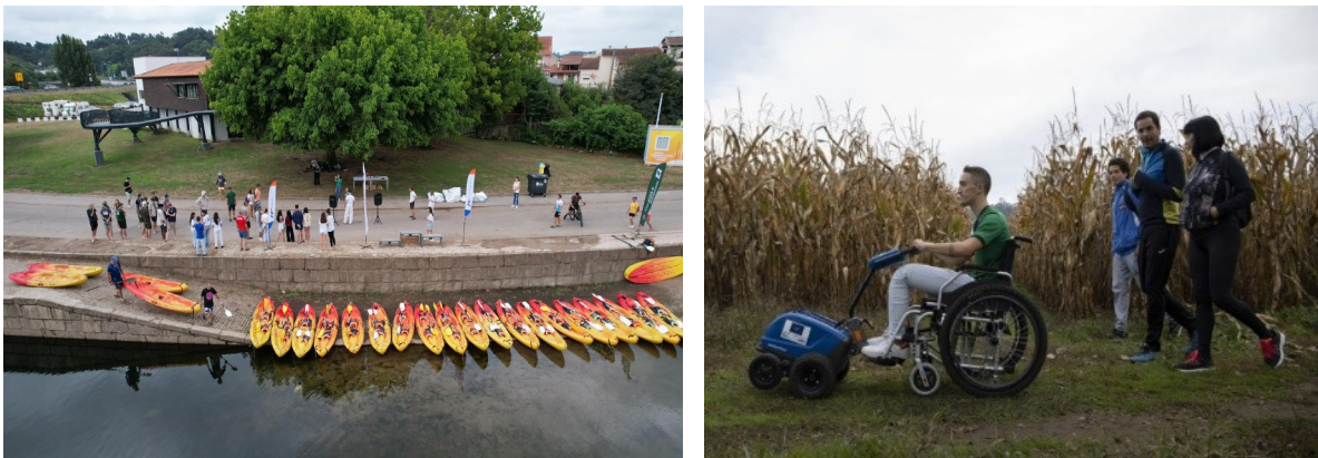
Figura 5 e 6: Dinamização de iniciativas na envolvente do C-Rio

No piso inferior (0) estão localizados os balneários e casas de banho , bem como toda a zona envolvente de jardim que é, também, um ponto de partida para a dinamização de outras atividades como a realização de percursos interpretativos/pedestres, passeios de canoa (e outras atividades desportivas), bem como de diversas iniciativas lúdico pedagógicas possíveis de desenvolver no exterior.