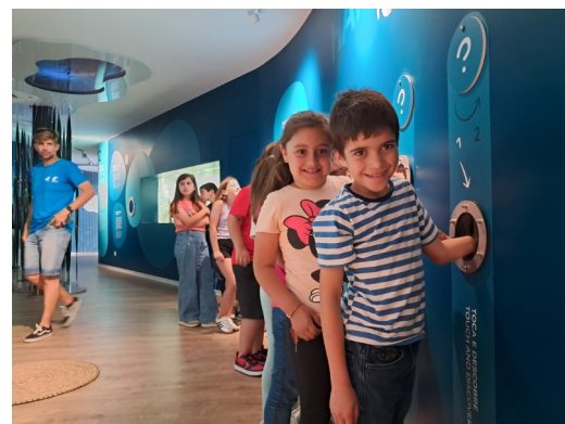
Figura 7: Visita guiada ao C-Rio